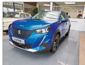
Peugeot e-2008 50kWh Allure

Erstzulassung: 08 / 2020, 25.900 km Elektro, Automatik, 136 PS / 100 KW Wagenfarbe: blau