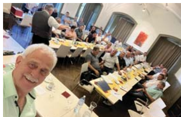
Bürgermeisterkonferenz im Schloss Tollet

Wesentlich ernster ging es natürlich zuvor bei der Bürgermeisterkonferenz zu, wo wichtige Themen wie die Nachbesprechung der EU-Wahl mit gleichzeitiger Vorbereitung der Nationalratswahl, aktuelle Berichte aus dem Gemeindebund, Informationen