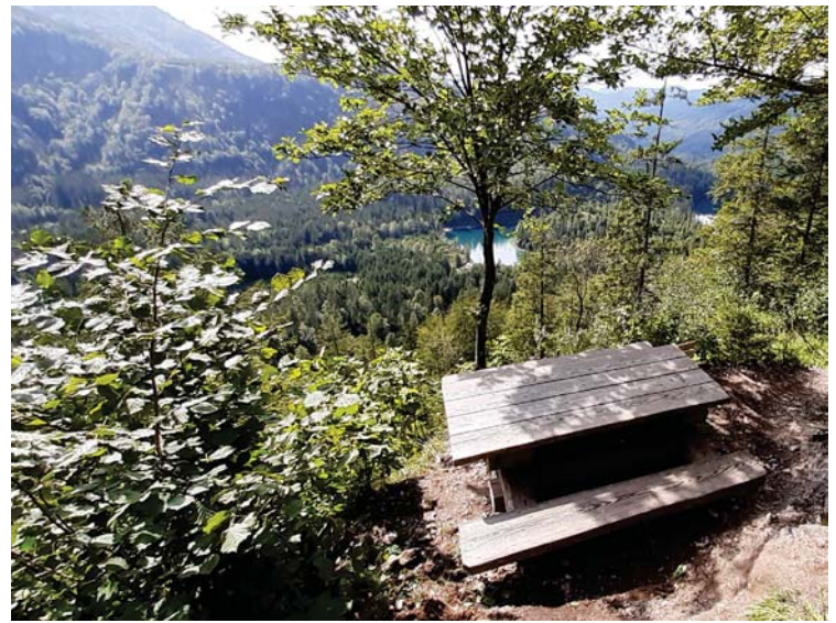
Der Herrentisch über dem Ödsee

Solche „zieren“ zum Beispiel Weg Nr. 438, dieser führt vom Gasthaus Enzenbachmühle bis zum Hochsalm Gipfel.