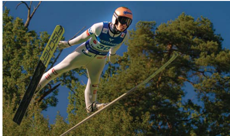
ÖSV-Adler Stefan Kraft holte sich die Auftaktsiege

HINZENBACH | Mitten im Sommer, am 13. und 14. August, startete im französischen Courchevel der FIS Sommer Grand Prix. Dort konnte der ÖSV-Adler Stefan Kraft an beiden Wettkampftagen den Sieg holen. Das oberösterreichische Hinzenbach ist am Samstag, 28. September und Sonntag, 29. September nun die vierte von fünf Stationen der Sommertour der Herren-Weltelite im Skisprung.