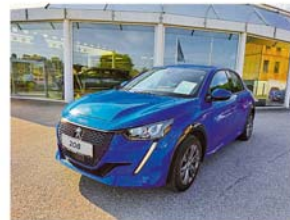
Peugeot e-208 50kWh Allure

Erstzulassung: 08 / 2020, 39.400 km Elektro, Automatik, 136 PS / 100 KW Wagenfarbe: blau