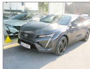
Peugeot 408 PHEV 225 e-EAT8 GT

Erstzulassung: 02 / 2023, 5.300 km Hybrid Elektro/Benzin, Automatik 1.598 ccm, 224 PS / 165 KW Wagenfarbe: Titanium Grau Titanium Grau METALLIC, On Board Charger 7,4 kW, 1 phasig, Fahrer & Beifahrer Komfort Paket Plus, Zweifarbige Leichtmetallfelgen Monolithe 20 Zoll, Rückfahrkamera mit 360°-Umgebungsansicht, Beheizbare Frontscheibe, FOCAL Soundsystem®, Induktive Ladestation €44.950,-