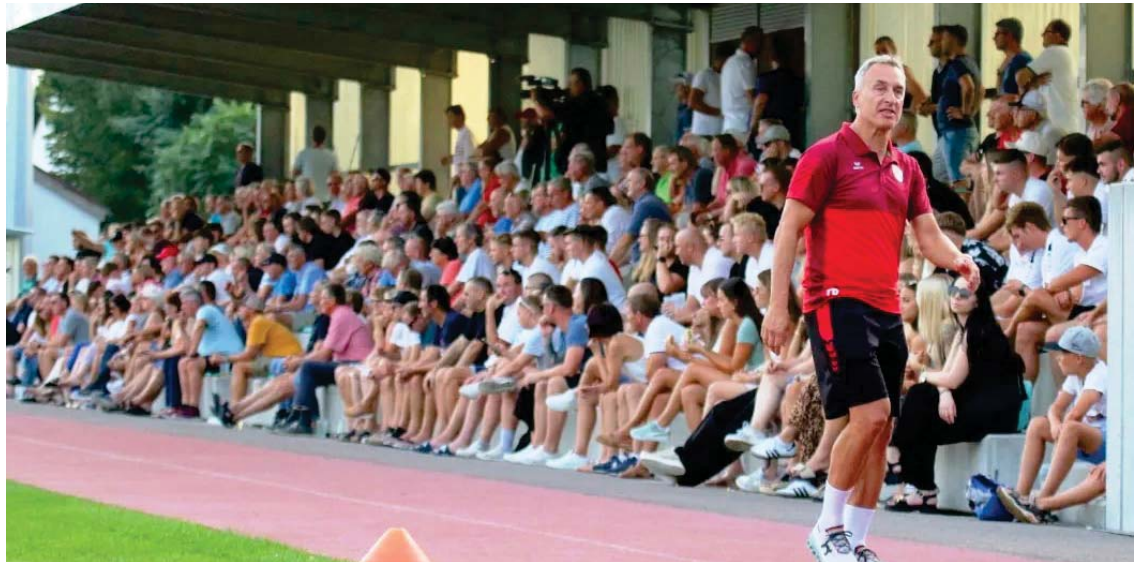
Volles Haus in der Guntamatic Arena Peuerbach gegen Andorf