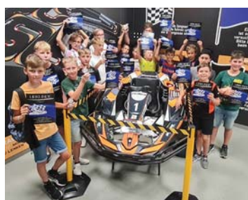
Gruppenfoto der Teilnehmer der Ferienaktion der FPÖ Waizenkirchen

Bei der Ferienaktion der FPÖ Waizenkirchen wurden die Jungs in zwei gemischten Gruppen zuerst in einem Qualifying auf die Probe gestellt. Die Fortgeschrittenen und die Renn-Neulinge wurden daraufhin wiederum in zwei Gruppen eingeteilt und durften dann in je einem Rennen ihr Können