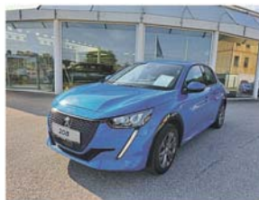
Peugeot e-208 50kWh Allure

Erstzulassung: 08 / 2020, 39.400 km Elektro, Automatik, 136 PS / 100 KW Wagenfarbe: blau