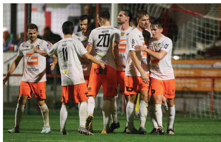
Wallern hat im Herbst viel zu feiern

Auch wenn der Herbstmeistertitel ein „Titel ohne Mittel“ ist, für die Peuerbacher Champs ist er ein Motivationsschub der Extraklasse in Sachen Rückrunde. Die wird aber extrem spannend, denn wenn Grieskirchen das Nachtragsspiel gewinnt, dann liegen mit Peuerbach, Grieskirchen, Andorf, Bad Wimsbach, Kammer und Gschwandt gleich sechs Teams der 16er Liga innerhalb von nur drei Punkten. Aber das ist eine ganz andere, nämlich eine Frühjahrgeschichte.