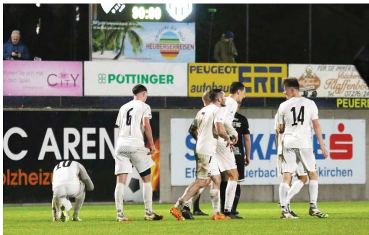
Peuerbach spielte sich zum Herbstmeister

Auch in der 1. Klasse Mittwest wird an diesem Wochenende, genauer gesagt am Samstag um 14:00 Uhr nachgetragen. So empfängt die Union Pizza & Baguette Haag/Hr. etwa Offenhausen oder Rottenbach den SV Europlan Pram. Apropos Pram. Die haben bis Runde elf noch immer eine Null in der Rubrik „Siege“ stehen. Die vier Zähler stammen von vier Remis. Besonders bitter war dabei das 2:2 im Derby gegen den UFC PTA, denn da kassierte man in Minute 100 den Ausgleich. Das Video von unserem TV Partner www.4viertel.tv war da natürlich ein echter Renner. In der 1. KL MW geht es übrigens „oben“ heiß her. So trennen Leader Zipf und den Siebten Taiskirchen gerade einmal sieben Zähler. Die Zipfer Boys haben allerdings schon ein Spiel mehr ausgetragen als die Innviertler. Dasselbe gilt für die Rottenbacher. Denen fehlen nur drei Points auf den Leader. Stark unterwegs ist auch Gaspoltshofen. Nach zwölf Spielen fehlt nur ein Pünktchen auf den Platz an der Sonne. Für Span-