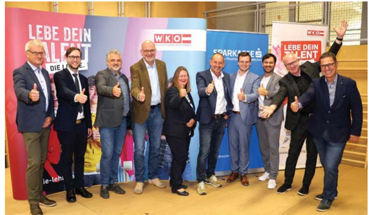
Gemeinsame Freude der VA-Partner

NEUKIRCHEN a. W. | „Der abgeleitete Slogan „Fahr nicht fort, mache deine Ausbildung und berufliche Karriere vor Ort!“ trifft den Nagel auf den Kopf.