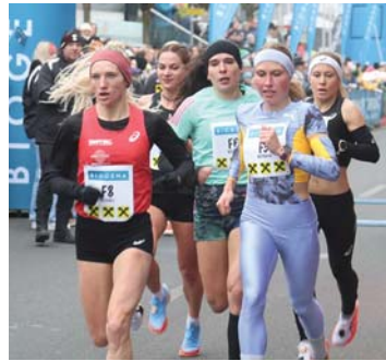
Neun Bewerbe machen den Int. Raiffeisen Silvesterlauf in Peuerbach zu einem besonderen Erlebnis

Danach folgen bis 12:15 Uhr weitere fünf Läufe mit dem Flöwi Lauf (400 Meter), der JOSKO Runde (850 Meter)