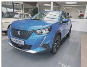
Peugeot e-2008 50kWh Allure

Erstzulassung: 08 / 2020, 25.900 km Elektro, Automatik, 136 PS / 100 KW Wagenfarbe: blau