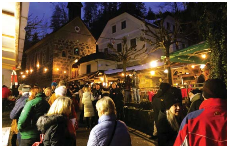
Viele Besucher von „drent & herent“ zieht jährlich der Weihnachtsmarkt in Kneiding im idyllischen Kösslbachtal an

Hier werden selbstgemachte Handwerkskunst, hausgemachte Weihnachtsbäckerei, Raritäten und so manche Advents- und Weihnachtsgeschenke angeboten. Der Kneidinger Adventmarkt findet heuer bereits zum 19. Mal statt. Er zieht sich auf einer Länge von knapp 500 Metern entlang des wildrauschenden Kösslbachs. Für das leibliche Wohl der Besucher ist natürlich auch bestens gesorgt. Adventschmankerl aus der Region und wärmende Getränke werden aufgetischt.