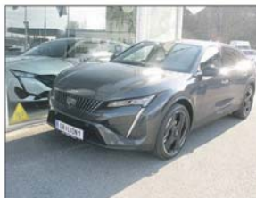
Peugeot 408 PHEV 225 e-EAT8 GT

Erstzulassung: 02 / 2023, 5.300 km Hybrid Elektro/Benzin, Automatik 1.598 ccm, 224 PS / 165 KW Wagenfarbe: Titanium Grau